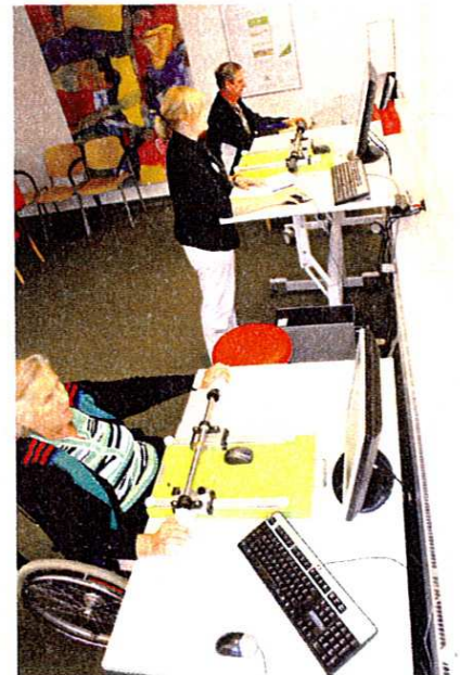
Abb. 1: Eine Therapeutin betreut 3 bis 5 Patienten

Die Integration des AL in den bewährten Therapieprozess eröffnet jedoch Möglichkeiten, den Therapieansatz zu vervollständigen, die Therapiedichte zu erhöhen und selbst neue Ressourcen zu schaffen, z.B. für zielgerichtete und alltagsorientierte Einzeltrainings (Abb. 1).