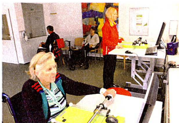
Abb. 6: Das Armlabor als „Marktplatz“ der Übungsmöglichkeiten

Die vorliegenden Ergebnisse rechtfertigen sicherlich noch keine Aussage hinsichtlich der Effektivität eines AL, jedoch lassen sich bereits Hinweise erkennen. Patienten setzen dem Empfinden einer passiven Hilflosigkeit ein aktivierendes „Mehr“ an Therapie für ihre paretische Ex-