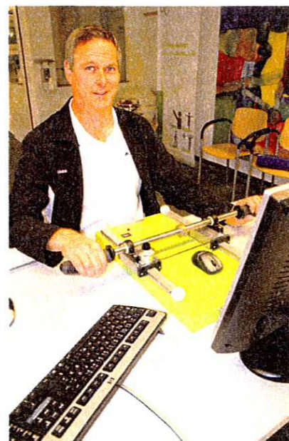
Abb. 7: Patienten trainieren motiviert und weitgehend unabhängig vom Therapeuten

Zwar ist Ergotherapie für Patienten mit hochgradigen Lähmungen zweifelsfrei wesentlich mehr als eine gerätegestützte Behandlung im AL, aber vielleicht ist es auf dem Weg hin zur Partizipation unserer Patienten eine intensive Unterstützung bei der Behandlung auf Impairmentebene (Abb. 7).