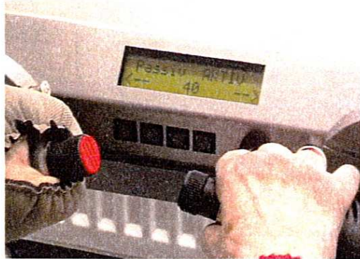
Abb. 2: Der Bi-Manu-Track in Pro-Supinationseinstellung

Der computergesteuerte Armtrainer „Bi-Manu-Track“ (BMT) trainiert bilateral die Pro- und Supinationsbewegung des Unterarms sowie die Dorsalextensions- und Palmarflexionsbewegung des Handgelenks (Abb. 2). Das Gerät gestattet drei Modi: passiv-passiv, aktiv-passiv (die nicht betroffene Hand führt die betroffene) und aktiv-aktiv (die betroffene Hand muss eine initiale Aktivität erbringen, um die Bewegung für beide Griffe freizugeben).